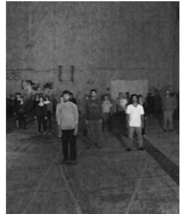
//////////////////// GRUPO DE DANZA MULTITUD Viernes 8 | 21:00 | Callejón de la Universidad - 18 de Julio y Tristán Narveja

Hoy sigue en pie el compromiso con las causas populares, intentando aportar un “grano de arena” a la construcción de la memoria desde la poesía y el canto.