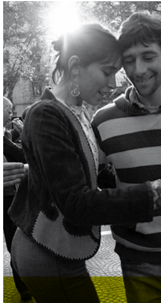
//////////////////// TALLER DE TANGO A CARGO DE AVALANCHA TANGUERA Miércoles 6 | 22:30 | Carpa Maestra Elena Quinteros.

Nuestro tango se nutre de diversas propuestas estéticas y estilos de baile. Prima en él una propuesta ética de compartir la experiencia de bailar con personas de las más diversas procedencias. En nuestros doce años de historia hemos sembrado grupos por más de treinta locales en Montevideo, diez ciudades del Interior y hemos realizado Avalanchas (Intervenciones Urbanas de Tango) en más de trescientas plazas y esquinas de todo el país. Así el tango se convierte en pretexto para el encuentro y el encuentro en pretexto para aprender a bailar.