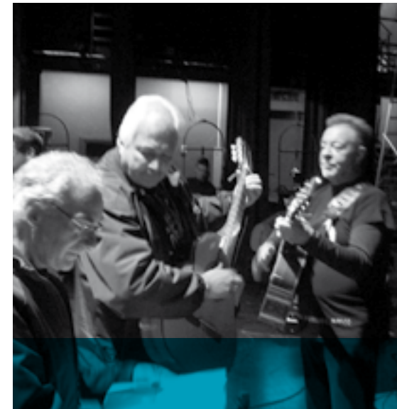
//////////////////// EL OCTETO Jueves 7 | 21:00 | Explanada de la Universidad -18 de Julio 1824, esquina Eduardo Acevedo-.

Con la convicción de que la música es no sólo una actividad de disfrute, sino una poderosa arma de educación, integración y desarrollo de nuestras capacidades, “Grupos Sonantes” se proyecta hacia un enfoque humanístico que privilegia la descentralización e integración social para todos los jóvenes de nuestro país.