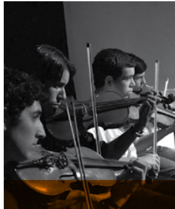
//////////////////// GRUPO SONANTES Jueves 7 | 21:00 | Paraninfo de la Universidad -18 de Julio 1824, esquina Eduardo Acevedo-.

Nuestro tango se nutre de diversas propuestas estéticas y estilos de baile. Prima en él una propuesta ética de compartir la experiencia de bailar con personas de las más diversas procedencias. En nuestros doce años de historia hemos sembrado grupos por más de treinta locales en Montevideo, diez ciudades del Interior y hemos realizado Avalanchas (Intervenciones Urbanas de Tango) en más de trescientas plazas y esquinas de todo el país. Así el tango se convierte en pretexto para el encuentro y el encuentro en pretexto para aprender a bailar.