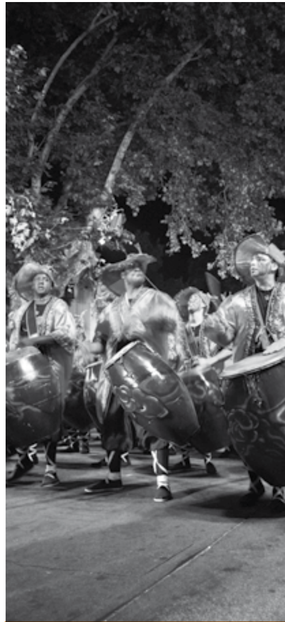
//////////////////// COMPARSA LA JACINTA Viernes 8 | Callejón de la Universidad - 18 de Julio y Tristán Narvaja

La Jacinta es una Comparsa que desarrolla un proyecto cultural en el barrio Jacinto Vera (Montevideo, Uruguay), teniendo como centro la expresión cultural de los afro-descendientes uruguayos: el Candombe