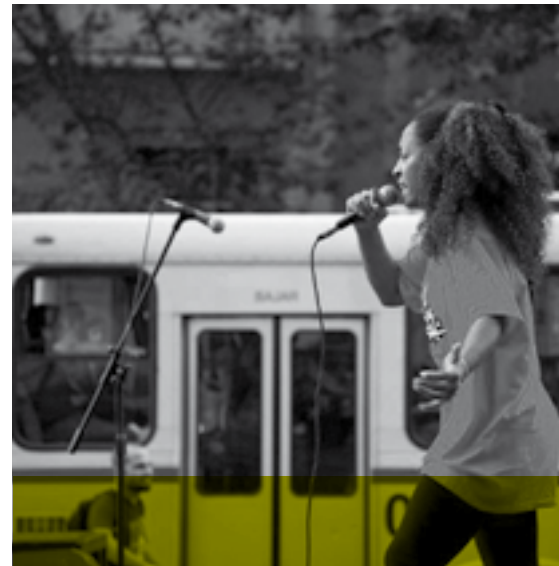
//////////////////// MC VIKI Sábado 9 | Cierre de la mañana | Carpa "Maestra Elena Quinteros" - 18 de Julio 1824, esquina Eduardo Acevedo.

La Jacinta es una Comparsa que desarrolla un proyecto cultural en el barrio Jacinto Vera (Montevideo, Uruguay), teniendo como centro la expresión cultural de los afro-descendientes uruguayos: el Candombe