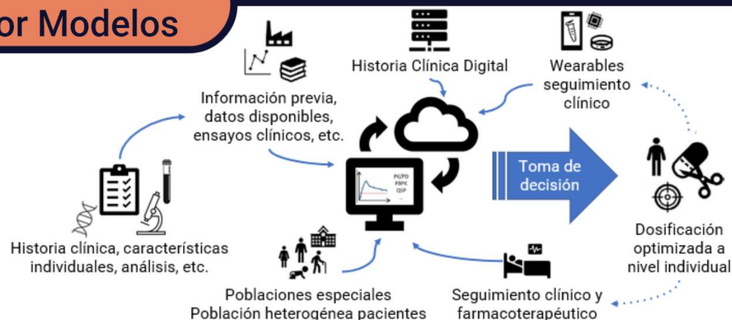
Imagen adaptada de Kluwe et al. (2021), Perspectives on Model-Informed Precision Dosing in the Digital Health Era: Challenges, Opportunities, and Recommendations.